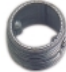
9- Spojnica 1"