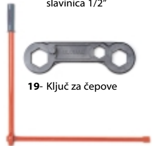
19- Ključ za čepove