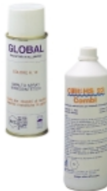
18- Tečnost Cillit Combi