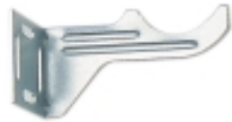
3- Ugaona konzola