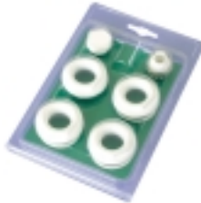
43- Komplet redukcija 3/8" sa silikonskim dihtunzima za GL, VIP, MIX, VOX, EKOS