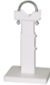
15- Nosac duplih radijatora