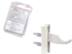
27- Regulišući nosač radijatora u paru-beli sa gumom, šrafom i tiplom